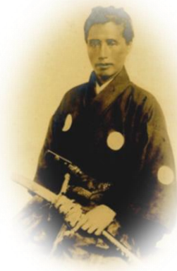
勝海舟